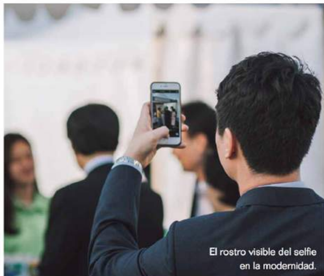
El rostro visible del selfie en la modernidad.